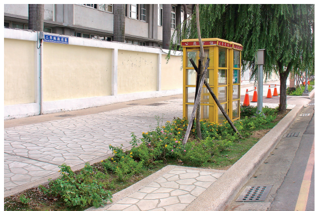
圖4 社區環境綠美化營造點已被剷除並重新進行綠美化工程