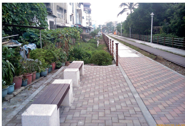
圖8 經過二年後因無社區經費維護，由政府全部改變為人工型之步道

解社區綠美化最終的目標，主要以社區為主，政府為輔，透過社區領袖代表的號召下，往往能讓社區民眾走出戶外，一同投入環境綠美化行列，也因社區民眾的加入，社區所執行的成果其後續維護管理情形較佳，營造成果更易成為社區活動的休憩活動空間。社區參與心態的不同，即會造成社區環境改善之社區認同度的差異，少數社區動員能力薄弱，常將個人己見放大解釋作為社區意見，看不到團隊合作的精神，更難以得到社區認同。因此，當社區認同度高的社區，其營造成果會感受到「物超所值」，當社區認同度低時，社區營造之成果則產生「低價值感」之情形。