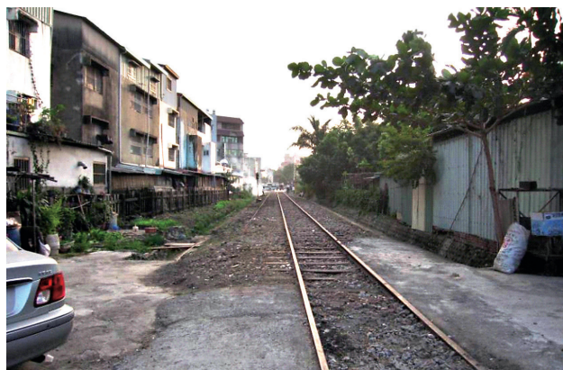
圖5 原由社區居民提出環境改善之廢棄鐵道原貌

思考營造成果可為社區帶來的機能性，重視後續維護管理之責。政府單位對於培訓課程的資源投入已執行多年，目前嘉義市的社區規劃師普遍仍有依賴輔導團隊之迷思，社區規劃師僅需在旁觀看學習即可之心態，對於專業技術能力掌握度較為薄弱，但卻在意社區規劃師認證身分能否被延續，因此，當政府部門輔導機制退場後，社區營造工作即代表「停止」，無法達到