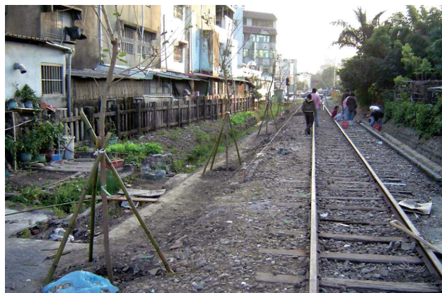
圖6 社區居民開始動手改善鐵道環境