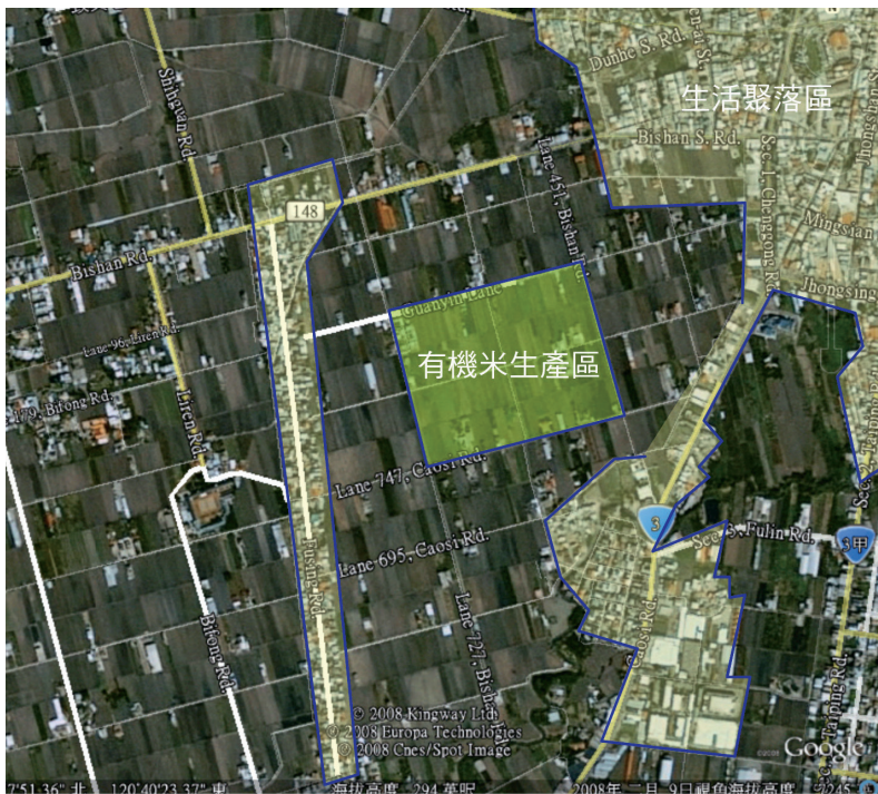
圖1 有機米生產區周邊社區環境

以社區需求為主要訴求，而是以社區中有那些空間可供改造為訴求，不論社區中居民是否有意願，以投入經費可以執行為主要思維，而其結果只是看到許多不知為何而來的成果？探究其因，都市社區中缺乏「人的因素」，從民國80年初期所推動之社區總體營造，主要先從「人」的營造開始，但人的營造在尚未成熟時，即開始進行社區硬體營造，初期有許多人的因素加入硬體中，但因社區中「人」的衝突而開始轉變，有人退出、有人強勢，最終硬體的營造「人的因素」變成了只是一種的「成果背書」，這是