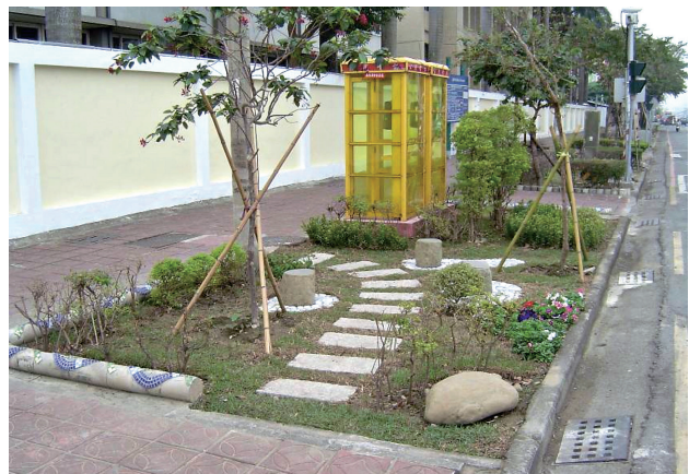
圖2 社區環境綠美化營造點完工樣貌

機制，以嘉義市的社區規劃師為例，大致可分為三種類型，第一類是「利用計畫以達個人利益」型，把社區綠美化計畫當作個人補助，提出自身住家周邊環境改善提案，並講求個人利益，期待輔導團隊能從頭做到尾，甚至提出應有協力費用的補貼，無後續管理維護之責；第二類為「要求資源進入社區，無心維護管理」型，把社區綠美