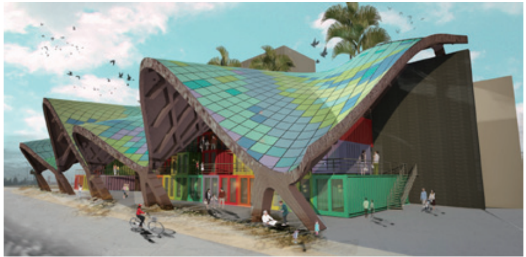
原住民文創聚落 (九典聯合建築師事務所提供)

標。以建築的觀點將車站融入地方的特色，鐵工局特別成立「設計元素提供及諮詢委員會」，為設計建築師提供在地文化特色及文史資料、觀光區位及功能、地區需求、農特產等，以作為納入車站整體設計構思之參考素材。該委員會成員包括地方文史工作者、地方學校建築學者專家、觀光局、地方政府、台鐵局及本局代表。希望藉由這種設計機制與模式，透過建築師巧妙的設計手法來創造空間效果及造型語彙，達到具有國際水準的設計案，建構一個永續發展兼具多元文化內涵的車站建築為後山觀光加分。台東地區沿線計有台東站、鹿野站、關山站、池上站，由大藏聯合建築師事務所甘銘源建築師設計。其中台東站整合了站前廣場景觀及交通動線，更規劃有後站出口動線銜接史前文化公園二期（中冶環境造型顧問公司郭中端景觀設計師設計），完成後將是全國第一座與大規模的考古歷史遺跡結合在一起的車站。