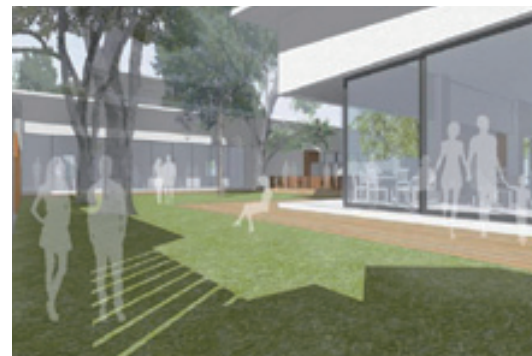
國際觀光魅力據點 (皓宇工程顧問公司+何侯設計提供)

水、綠資源，海洋文化與住民特色，共同展演出太平洋左岸之都市意象。推動養生休閒產業計畫 & 推動人才東移計畫從現有市場供給面、整體環境面、潛在需求面及產官學民進行訪談及99年起辦理推廣行銷及啟動地方產業輔導，除漸次釐清面臨的課題，更確立了在發展實體園區的開發選項外，東部地區在發展養生休閒業發展及人才移住的論述上，更需要在東部地區自然環境特性的基礎上，進行土地滋養、農業生產、藝文創作、旅人接待，方能保有有別於西部發展的優勢。推動東臺灣養生休閒產業及人才東移的溝通平台，