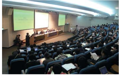
市民公開國際論壇