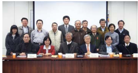
臺灣都市建築容積獎勵與移轉公共政策座談會