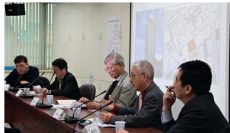
臺灣都市建築容積獎勵與移轉公共政策座談會