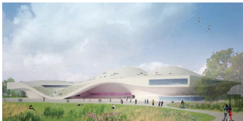
衛武營藝術文化中心