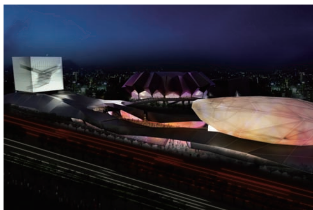
北部流行音樂中心