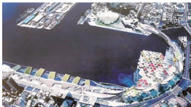
南部海洋文化及流行音樂中心

失去專業補助，場地僅供租用，尤其是表演場所影響更大，如筆者擔任高雄市立中正文化中心管理處長之初，全年度經費僅列百餘萬，又必須統籌文化中心有關表演、展覽及圖書等業務，確實無法從事開創性的工作。