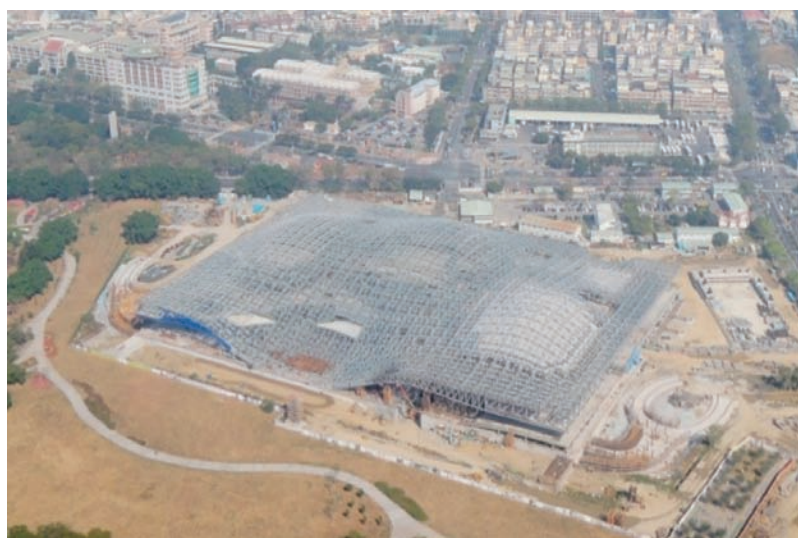
衛武營藝術文化中心施工現況