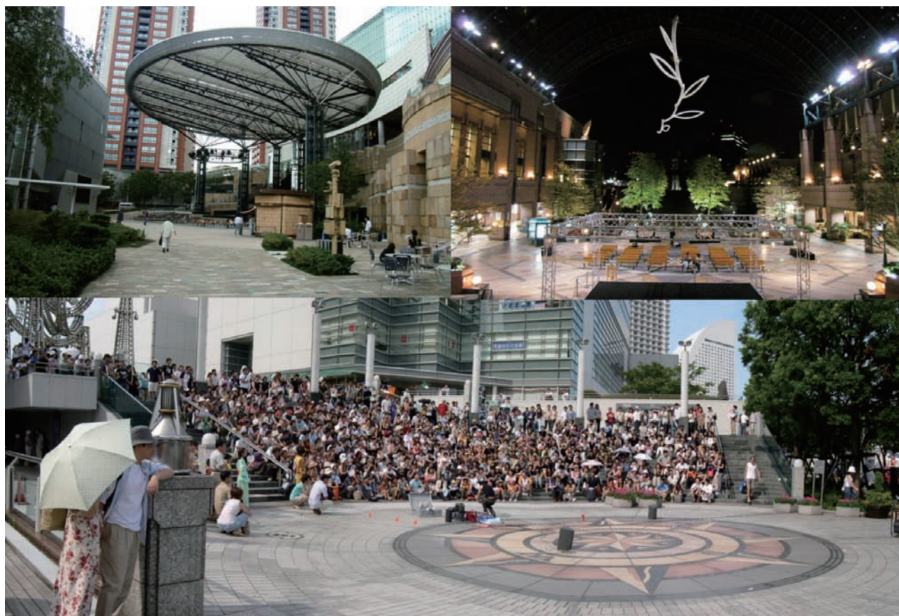
圖4 營造有利在地萌芽中表演者發展所需之戶外或半戶外活動空間並配設相對的基礎性表演設備

系統間服務水準失衡或過於繁複而與建築空間水準不匹配、過於輕忽政府財政無法負擔過重之日常營運階段硬體管理維護修繕所需經費等問題。另一方面，縣市文化中心演藝廳設施，亦應能支援萌芽中之個人或小型團體多樣化之演出環境需求。此類萌芽中之個人或小型團體，除嚴肅或古典藝術表演者外，更包含鄉土民俗、流行及青少年文化等表演藝術類型之表演者。一般而言，上述非嚴肅或非古典表演藝術活動之合宜發生場域，對於台灣縣市文化中心演藝廳設施而言，或許就是演藝廳設施的室內附屬(排練室、大廳等空間)、半戶外(門廊或雨棚等)及戶外空間(廣場、綠地等)。演藝廳設施營運者若能以分時共享空間的思維，引導此類活動活絡發生於上述空間，將可使表演藝術全天候出現於演藝廳設施所屬場域中，可適度填補演藝廳設施於室內主廳活動空檔之使用者離峰時段，使演藝廳設施之空間