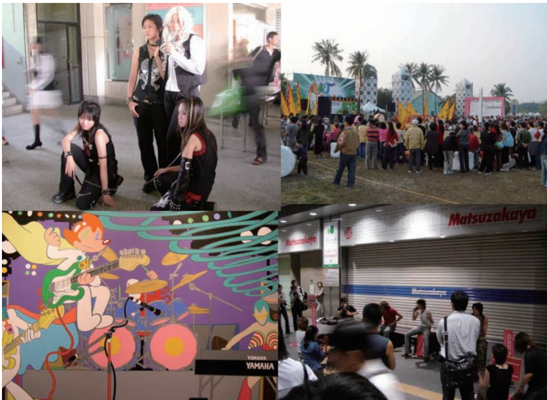
圖3 文化中心演藝廳設施可考量以正面支持性的態度引入非嚴肅或非古典表演藝術活動以達到多元藝術的供應並滿足不同階層民眾對表演藝術之多樣化需求