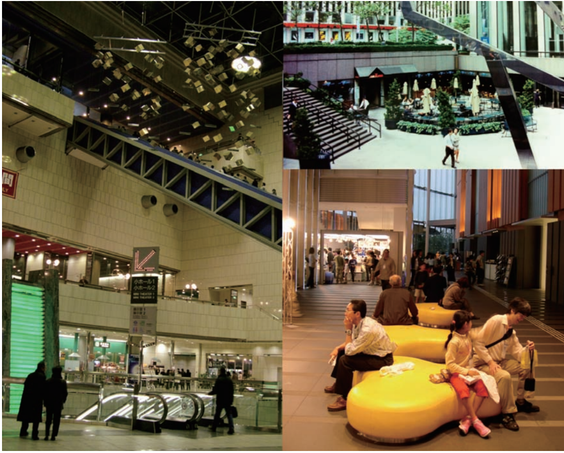
圖2 引入與表演藝術相關的衣、食、育樂等休閒或精神的商業服務以活化演藝廳附屬室內、外空間