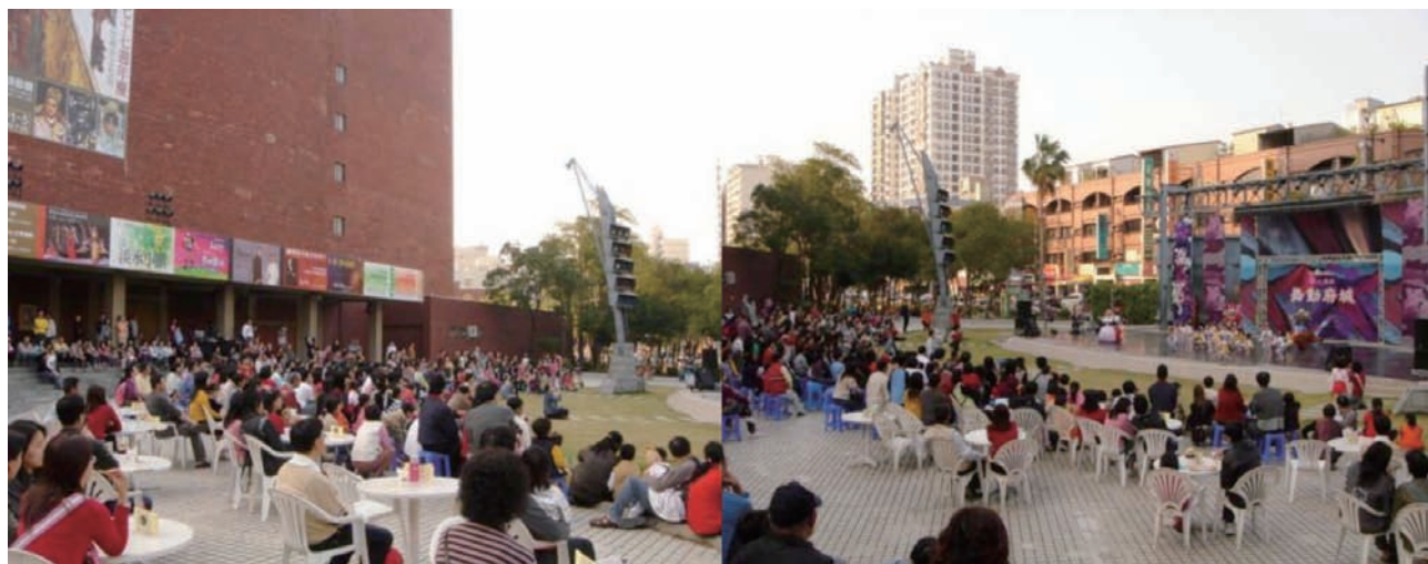
圖1 常有較為多樣化觀眾族群出現之戶外表演空間

回應此一問題，若基於非直轄縣市文化中心演藝廳設施之觀眾族群特質、縣市政府面臨之財政困境，並從本文對於“拓展並培養經常性表演藝術活動觀眾”所論述之觀點思考。縣市文化中心演藝廳設施，首先應能提供一個可完善支持表演藝術節目正式演出的專業場地，供茁壯中之在地中、小型表演團體使用，使其能累積向上成