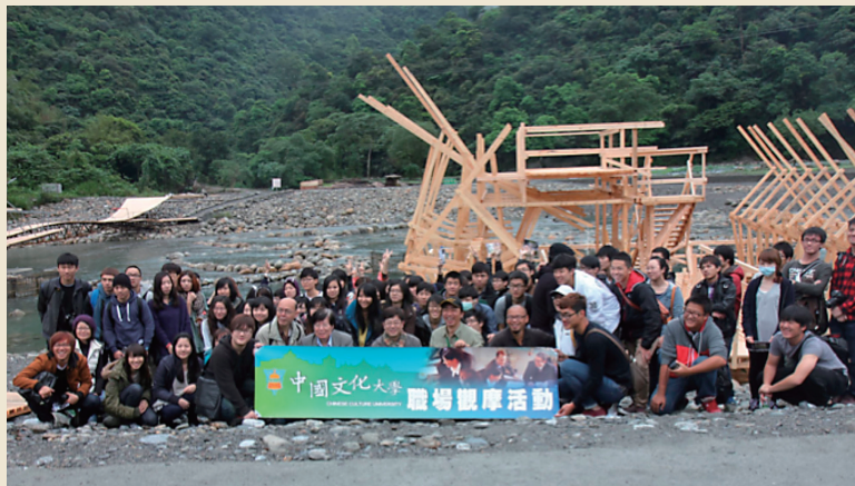
2013年宜蘭綠色博覽會

場”及“時代”的改變，工作形態也逐漸隨著演進，這絕不僅僅是從“筆”到“滑鼠”，也不僅是由“CAD”到“BIM”，工具固然會變，但是我們都認為真正最重要的還是建築教育本身必須要“change”，但這個改變並不是創新，因為建築師終究還是建築師，做的事情還是建築設計這件事。我們在中國文化大學建築及都市設計系，我們要做我們做得到的目標，或說我們到底要訓練學生們能做些什麼，我們確實花了些時間討論，對文化建築而言這是一個大事情，因為我們也已有五十年了，我們一直是一所四年制的建築系，這五十年來好像也不曾影響我們所訓練出的建築師，但是我們竟然想進步想改變，如同楊重信院長所說：我們不能自我感覺良好，所以我們必須自我批判、自我反省，幾次討論中，我們都認同建築師的訓練並非停止於畢業，學習是一件不會停止的事情，只是由“他人教授”轉成“自我學習”，這現象說明老師們除了要教會基本建築技能，其實我們更重要的是要教年輕建築學子們“如何自我學習”、“正確的學習”且貫徹自我的想法，這聽起來很簡單，但是我們認為這很重要，我們認為如果僅是追求業務而停止學習，這將會是一場建築界的災難，所以困難的事情就是如何在課程中達到這自我訂定的目標，第一、我們很不創新的認為，既然建築設計是建築師最主要的執業手段，以建築設計課整合其他相關專業課程仍是最佳的解答，第二、課程的貫徹必要由老師執行，所以我們招聘具熱誠且有英語教學能力之建築設計師資，這是因應建築市場國際化之準備，這將是這個世代面臨的不可避免條件，第三、多元建築設計課程，我們在不同年級給予不同之“教學資源”，如建築設計工作營，包含跨領域、跨年級建築設計工作營，國際建築設計營、足尺實作實習及移地教學等不同資源，第四、有教無類因材施教之小組師徒制教育，我們