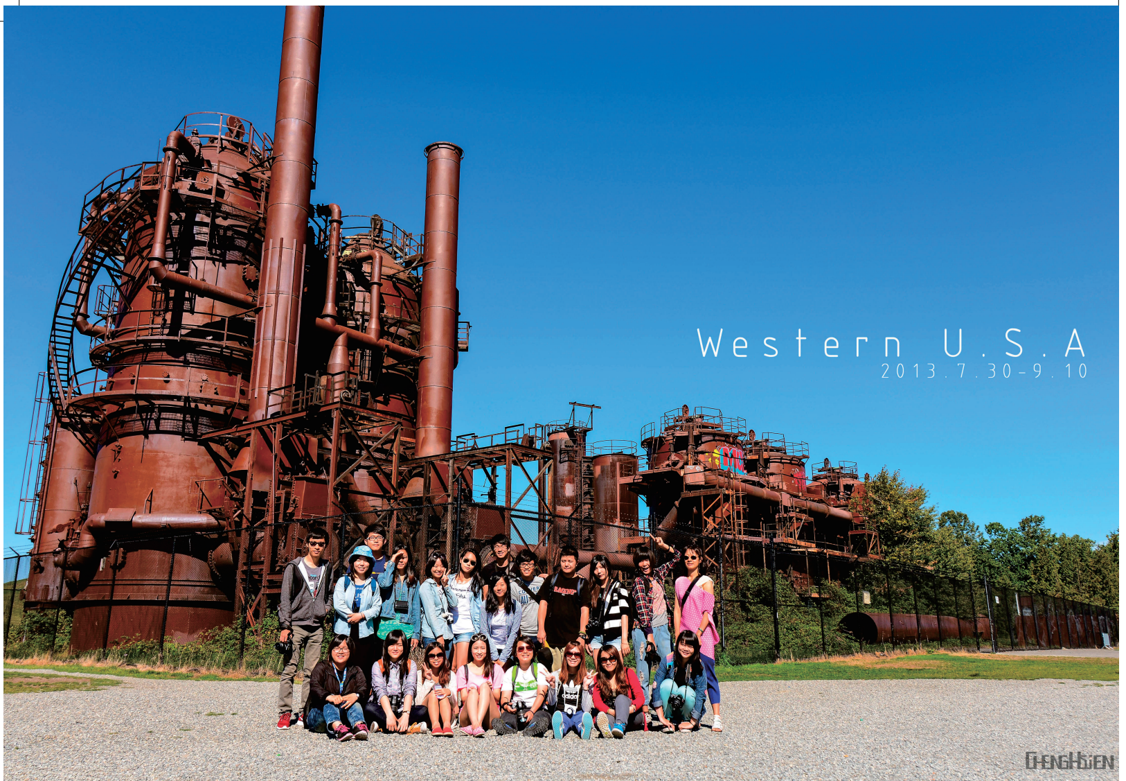
全球研習-2013美西組-GAS PARK 大合照-林呈軒

法，我們將本系同學與建築和財法系的同學打散分組進行對話，此外也提供可讓全校各系同學選修的「永續環境營造學程」促進跨領域對話。