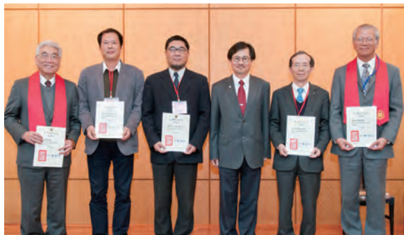
感謝獎學金捐助單位與個人