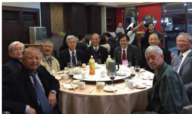
會後於台科大校園內蘇杭餐廳舉辦會員聯誼餐敘