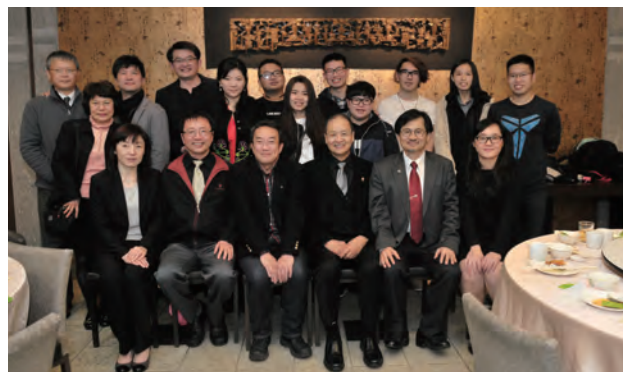
會後於台科大校園內蘇杭餐廳舉辦會員聯誼餐敘