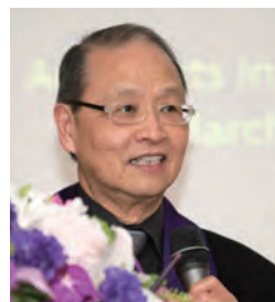
吳和甫教授專題演講