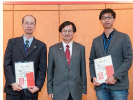
104年度建築學報論文獎得獎者合影