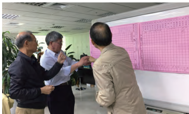
第20屆第1次理事會記票