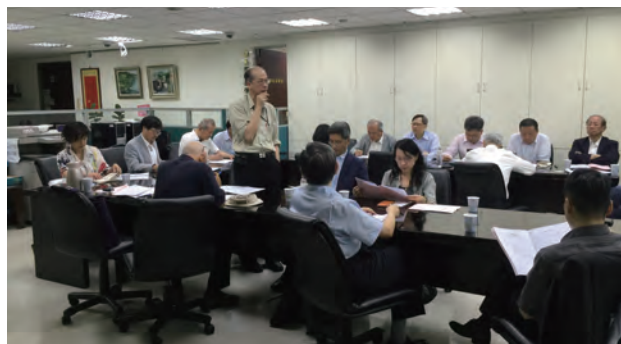
第20屆第2次理監事聯席會議