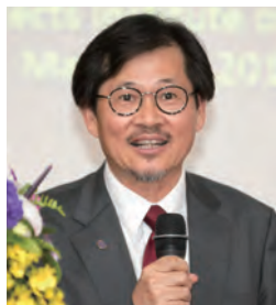
鄭理事長主持大會