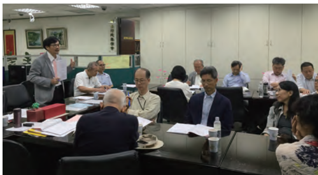
第20屆第2次理監事聯席會議