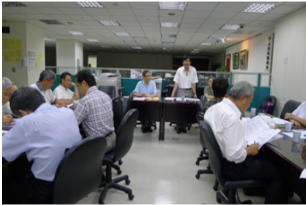
103.07.17 第 19 屆第 7 次理事會