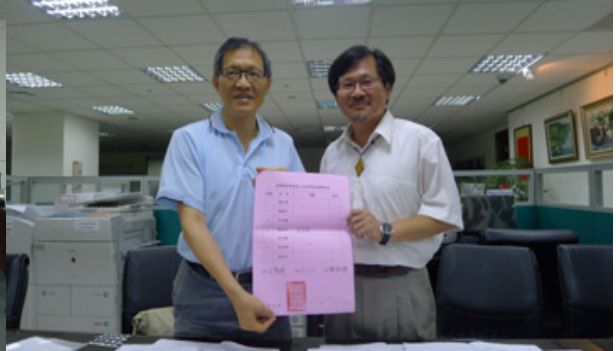
103.07.17 第 19 屆第 7 次理事會