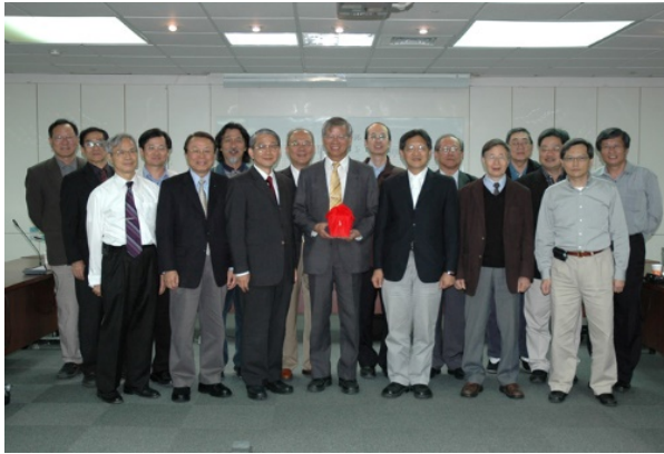
98.12.11 第 18 屆理監事合影