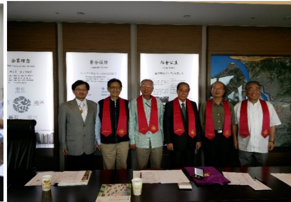
104.06.16 第 19 屆第 4 次會士會