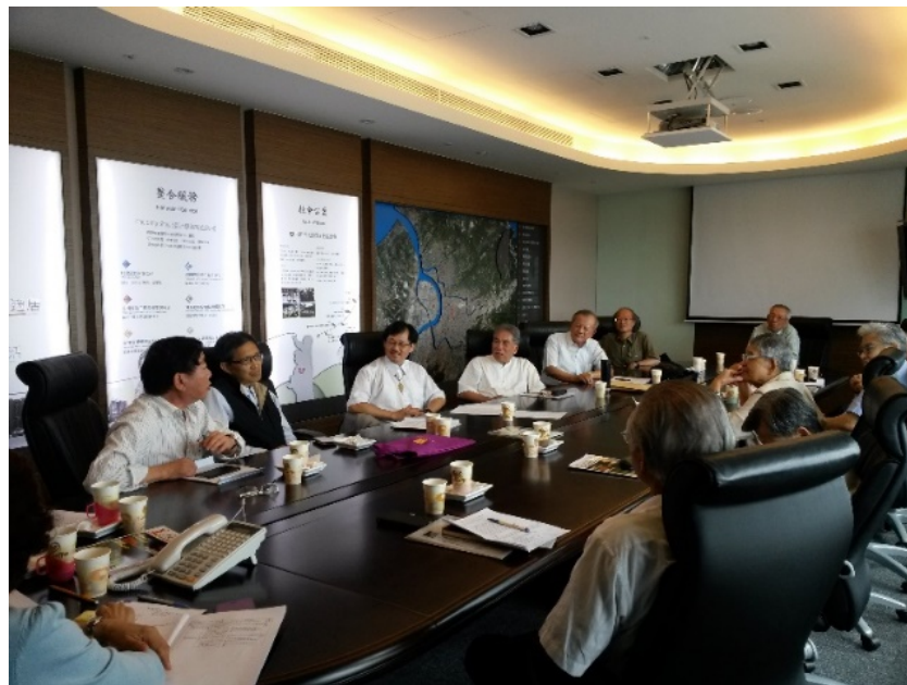
104.06.16 第 19 屆第 4 次會士會