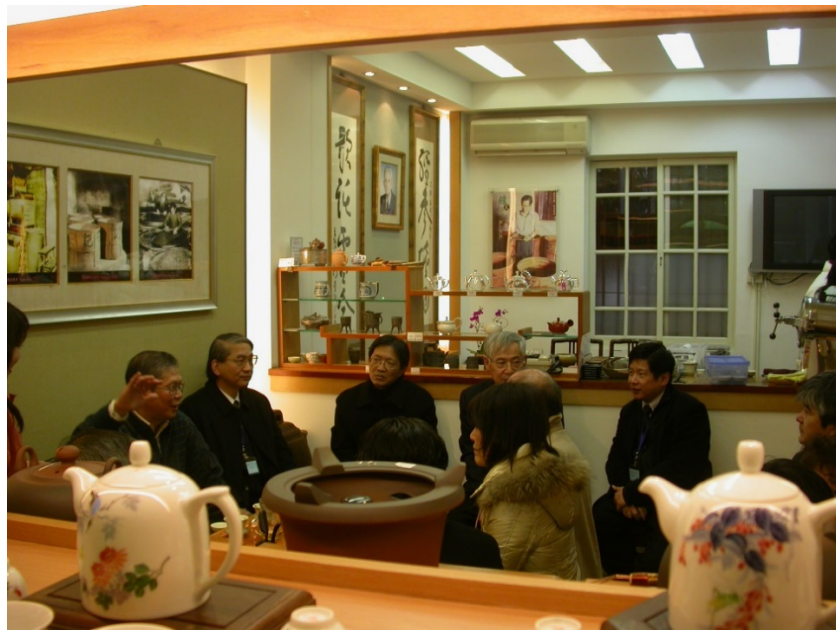
王有記茶行參訪座談

日本建築學會關東支部埼玉支所透過我國外交部日本事務會請本會安排參訪歷史建築行程，並期與我國建築專家交換意見，本會安排參觀華玉住宅大樓、華山創意文化園區、市長官邸藝文沙龍、台大藥學館、「北福·大稻埕」辦公大樓、王有記茶行參訪座談，整體行程由本會規劃、臺北市府都市發展局協助，參訪後並於喜來登大飯店晚宴。